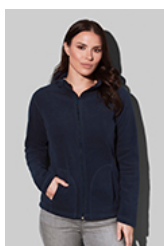
ST5100 Fleece Jacket